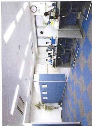
小田急小田原線の本厚木駅から徒歩5分の場所に店舗を構える同社。店内はテンブルながらも清潔感のある雰囲気

ホームページを開設するに当たり、お客さまへ安心感を与えるため、スタッフ紹介のコンテンツを写真付きで公開。また、厚木市の良さを伝えるため、地域のイベントスケジュールや住まいに役立つ施設の紹介など、地域情報を充実させました。こうしたコンテンツは反響の即効性は薄いかもかもしれませんが、一度ご覧になられたお客さまが部屋探しの際、厚木市、そして当社を選択肢の一つとして選んでいただけたらと考えてのものです。また、当社ではブログやツイッターなども行なっているため、こちらへのリンクも設け、アクセス数アップの相乗効果を図っております。