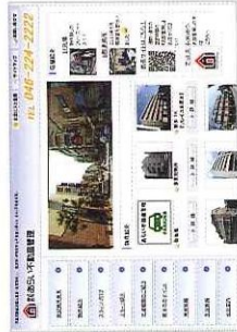
あらい不動産管理さまのホームページ [http://www.aif.jp]