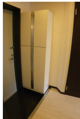
2段の大型シューズボックス