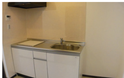
広くて使いやすいキッチン(120cm)