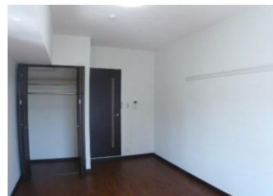
大型クローゼット(幅約120cm奥行95cm)