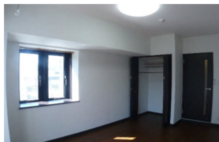
居室・建具の色はシックなブラウン(茶)基調