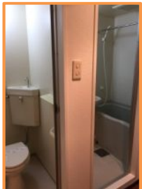
バス・トイレ独立