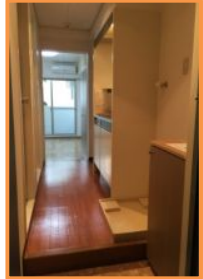
広いキッチンスペース