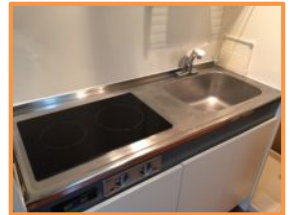
キッチン2口電気コンロ