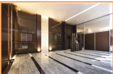
格調高い雰囲気のエントランス