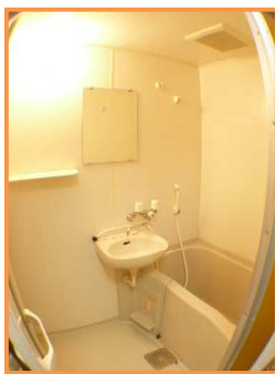
バス・トイレ独立タイプ