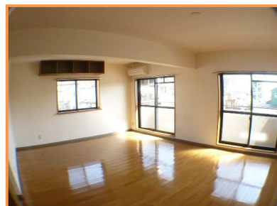
遮音性フローリング