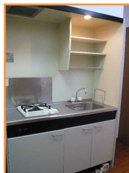
ミニキッチン(ガスコンロ有り)