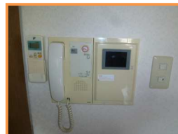
室内モニターホン