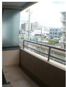
専用バルコニー有り