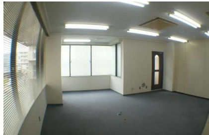
床材は、タイルカーペット仕様