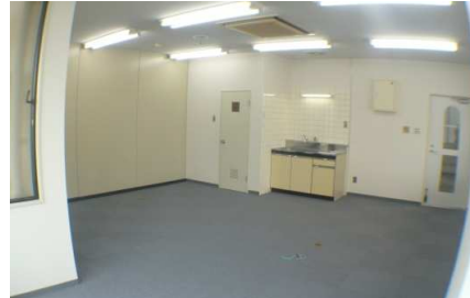
2階角部屋 明るい室内