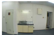
キッチンセット有り