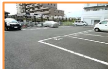
敷地内駐車場空き有り