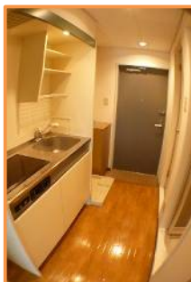
電気コンロ(2口タイプ)付