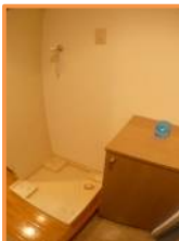
室内洗濯機 防水パン