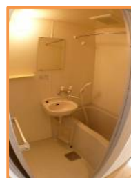
バストイレ 独立タイプ