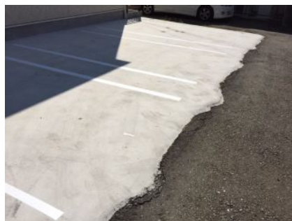
コンクリート舗装