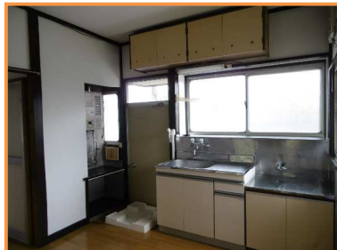
キッチン・室内洗濯機置き場(防水パン)